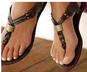
Alluce valgo addio. Piedi belli in poco tempo. Ecco come Benessere Lab