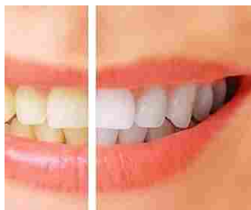
Sbiancare i Denti ingialliti naturalmente? Ecco un rimedio pratico ed efficace oggibenessere.com