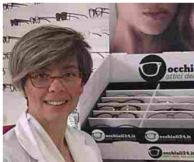
Nuove lenti progressive frutto dalle ultime ricerche a 319€ occhiali24.it