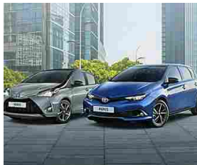
Toyota Yaris e Auris Hybrid: tue con bonus di €4.500 qualunque sia il tuo usato. toyota.it