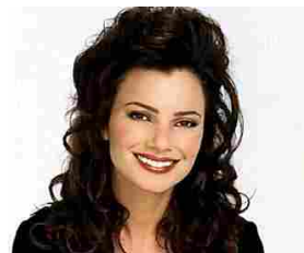
Serie tv anni '90: ecco come sono le star oggi! alfemminile.com