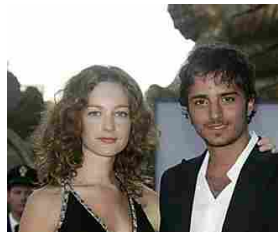
Tutte le coppie vip italiane dimenticate! Alfemminile.com